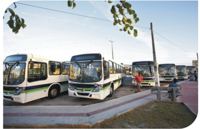
Novos ônibus fazem a linha Circular Indústria e Comércio

Os novos ônibus da Viação Modelo substituíram os veículos que fazem a linha Circular Indústria e Comércio II e são adaptados para deficientes físicos (com elevador, espaço para o cadeirante e assento para o acompanhante), além de assentos especiais para obesos.