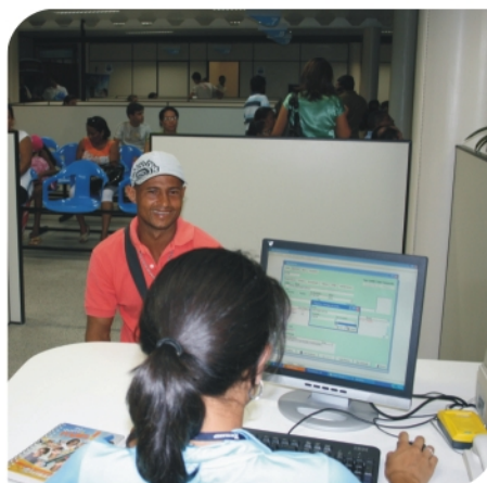
Sede do Setransp oferece atendimento personalizado