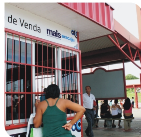
Postos de venda estão dispostos em pontos estratégicos da cidade