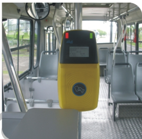
Validadores agilizam a passagem na catraca

Para concluir o processo de implantação da bilhetagem eletrônica na cidade, o Setransp lançou ainda, no mês de novembro de 2008, o Mais Aracaju Cidadania. O cartão é destinado a pessoas que não têm vínculo empregatício formal, são profissionais liberais, autônomos, donas de casa e todas as pessoas que utilizam o transporte coletivo nas suas atividades diárias e pagam suas passagens em dinheiro. Hoje, já são cerca de 15 mil unidades do Cidadania em uso. A expectativa do SETRANSP é ampliar esse número ainda mais.