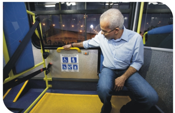
Prefeito Edvaldo Nogueira confere o espaço reservado aos deficientes físicos

"Estou muito feliz e quero agradecer a todos os empresários do setor de transporte. Daqui a 15 dias estaremos entregando mais 15 ônibus e em cerca de um mês vamos inaugurar a Central do Trânsito que ficará localizada na Superintendência Municipal de Transporte e Trânsito – SMTT", destacou o prefeito durante as solenidades de entrega dos veículos, ocorrida no Centro Administrativo de Aracaju, no dia 18 de setembro, e sob o Viaduto Jornalista Carvalho Déda, dia 6 de outubro.