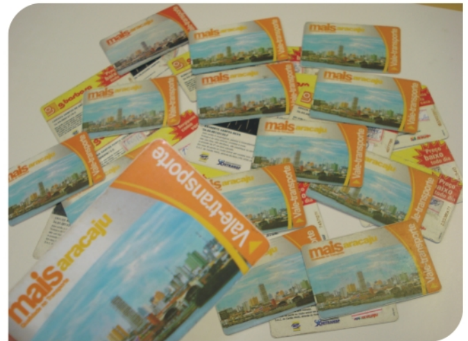
Cartões apreendidos foram devolvidos às empresas

Diante do exposto, o Ministério Público não vislumbrou dano ao direito do consumidor e determinou o arquivamento do procedimento. “O limite quantitativo atinge somente o cartão Mais Aracaju Vale-Transporte, cujo objetivo é para uso em deslocamento da residência até o local de trabalho do usuário, possuindo este, ainda, a faculdade de solicitar o cancelamento da imposição do limite quantitativo diário”, destacou o termo de audiência.